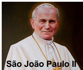
São João Paulo II

Dia: Ó Deus, que por vossa Palavra realizais de modo admirável a reconciliação do gênero humano, concedei ao povo cristão correr ao encontro das festas que se aproximam, cheio de fervor e exultando de fé. Por nosso Senhor Jesus Cristo, vosso Filho, que é Deus, e convosco vive e reina, na unidade do Espírito Santo, por todos os séculos dos séculos. Amém!